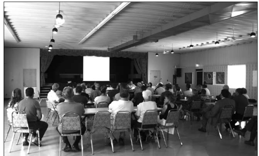
Assemblée de fondation juin 2007