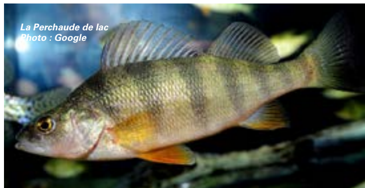
La Perchaude de lac

Le mot Achigan dérive de la langue algonquienne : « AT-CHI-GANE » qui se traduit par : « Celui qui se bat », en référence à son comportement extrêmement combatif, tant recherché par les pêcheurs sportifs. Son corps est comprimé latéralement avec bandes verticales sombres. Il possède deux nageoires dorsales unies et la mâchoire maxillaire ne dépasse pas le bord postérieur de l'œil, contrairement à celle de son cousin qui le dépasse (l'achigan à grande bouche). En général, sa longueur varie entre 30 à 40 cm (maximum 70 cm) pour un poids de 0,45 à 0,90 kg (1 à 2 livres). Sa longévité est d'approximativement 15 ans. Il se nourrit d'insectes, d'autres poissons et d'écrevisses. Fait à remarquer, au lac Deligny, on aperçoit fréquemment des spécimens de très grande taille (de 3 à 5 livres !). Bien que sa chair soit d'excellente qualité, l'achigan à petite bouche est un poisson sportif recherché surtout pour son ardeur au combat ; ses bonds hors de l'eau lorsqu'il est ferré procurent une expérience de pêche inoubliable.