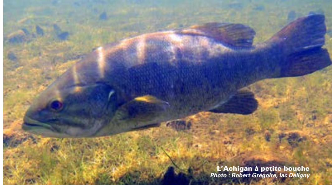
L'Achigan à petite bouche lac Deligny