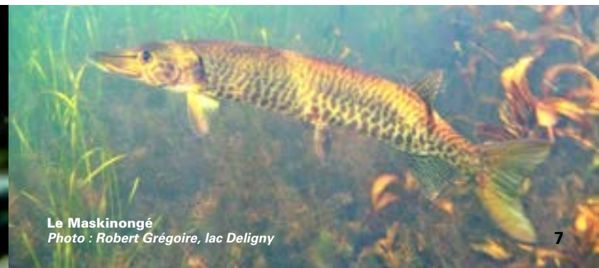
Le Maskinongé Photo : Robert Grégoire, lac Deligny